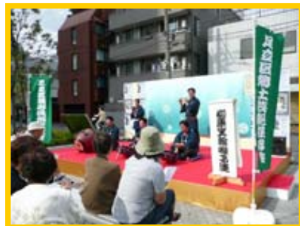
↑「お囃子」や「足立シティオーケストラ」「琴演奏」などのステージショーもあり、会場は大盛況でした★