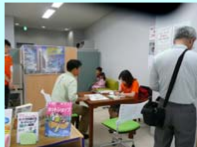
ご当選おめでとうございます★

産業センターと芸術センターではスタンプラリーを開催。合計3つのスタンプを見事集めると、芸術センター前で行われている抽選会に参加できました。景品の中には、温泉旅行券や、レストランお食事券など豪華景品も含まれており、参加者の方は目を輝かせて抽選会に参加していました。また、抽選会の景品に、産業情報室からは大型印刷機を活かしたカレンダーを提供しました。産業情報室で当選者の方の写真を撮り、カレンダーに取り込んで印刷するというオリジナリティ溢れる景品に、親子連れの方はもちろん、「記念になって嬉しいです」と、皆さん大喜びでした。