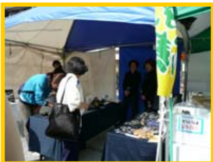
↑芸術センター前の広場では、足立区友好都市の物産品が売っていました。

↓芸術センター1階エントランスでは、全長6mにもおよび「千住宿復原模型」が展示されていて、圧巻！！